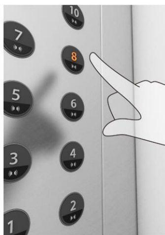
非接触ボタン「エアータップ」

またエスカレータに関しては紫外線を照射するLEDをエスカレータ内部に搭載し、運転中は常時ハンドレールを除菌する機能を搭載しております。お客様が安心してお買い物をして頂く為に、感染リスクの低減を図ることを目的に導入することにいたしました。