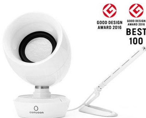
型式：comuoon SE Type BP