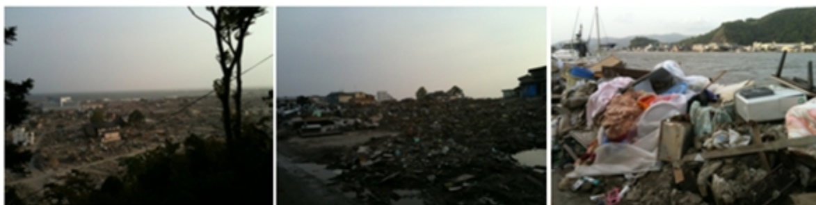
<宿泊場所から徒歩15分くらいの場所での光景>