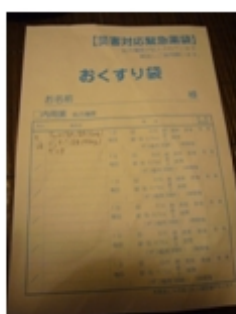
<災害対策緊急薬袋>